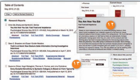
الشكل رقم ٤