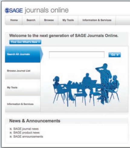
الشكل رقم ١