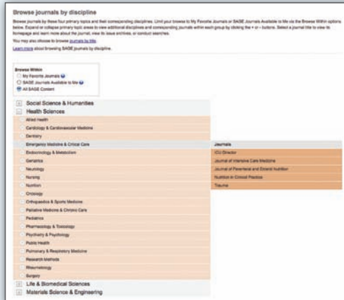
الشكل رقم ٢

من خلال أي خيار من الخيارين السابقين، بمجرد عثورك على المجلة التي ترغب فيها، انقر على عنوانها ليتم نفاك إلى صفحتها الرئيسية حيث يمكنك تسجيل اسمك من أجل الحصول على تنبيهات البريد الإلكتروني وعرض معلومات عن المجلة والوصول لمقالات "النشر أولاً على الإنترنت" وقوائم المحتويات والقيام بعمليات البحث على مستوى المجلات.